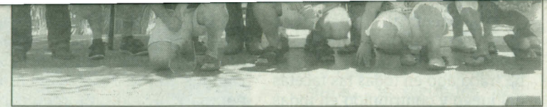
Podio final de la liga, que se ha disputado durante los últimos meses. N.L.A.